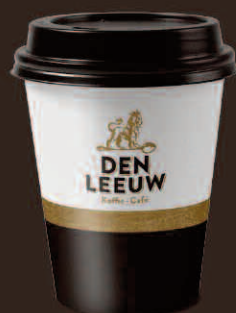
Take Away beker Lungo & Cappuccino