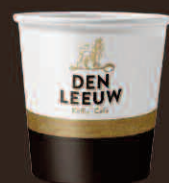
Take Away beker Espresso