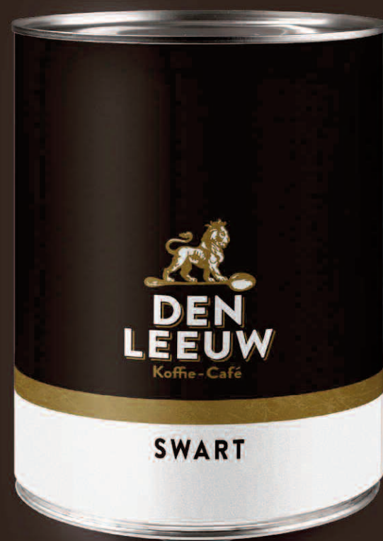
Blik Den Leeuw Swart, bonen