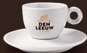
Servies Café Creme